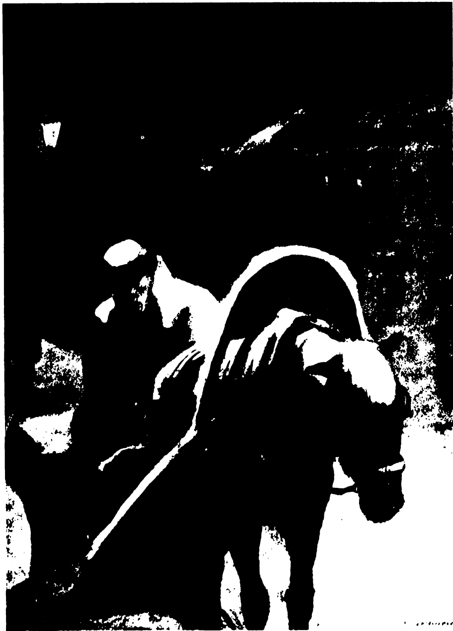
«Тоска». Художники Кукрыниксы