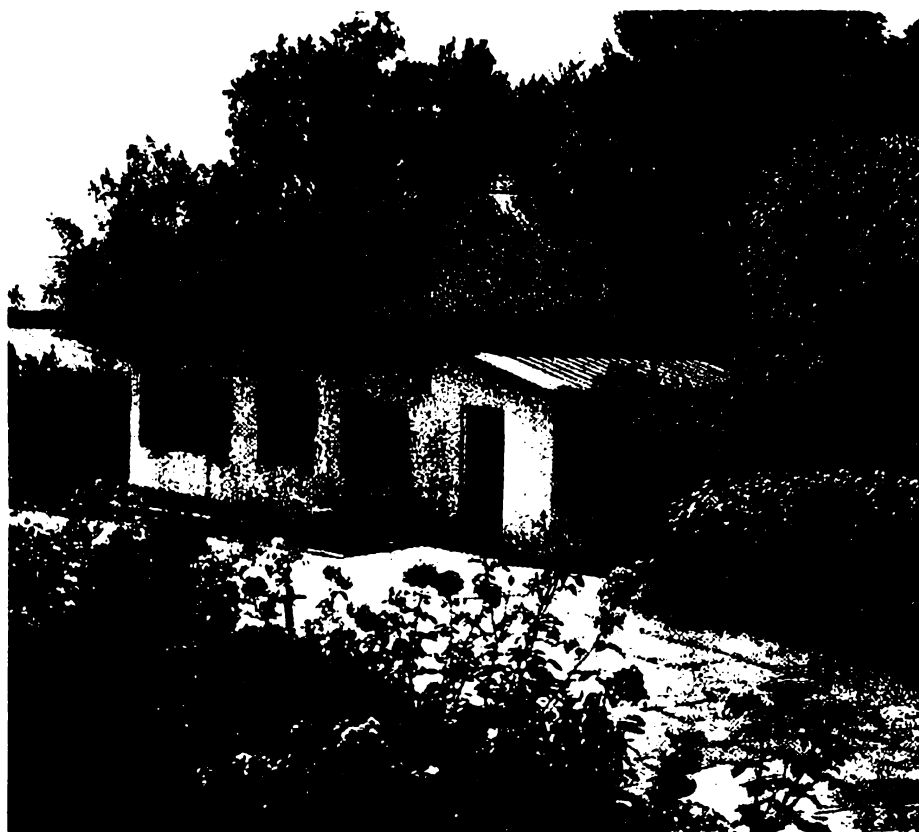
Мемориальный музей «Домик Лермонтова» в Пятигорске. Фотография

Пятигорские впечатления легли в основу повести «Княжна Мери», где описаны многие достопримечательные места города и окрестностей. На страницах повести мы встречаем упоминание о гроте Дианы, на площадке перед которым по вечерам собиралось