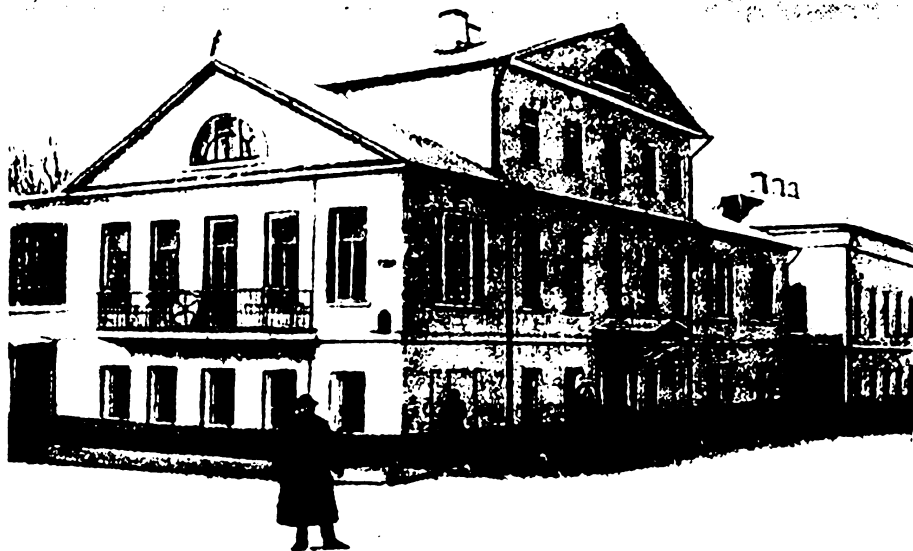
Дом Грибоедовых на Новинском бульваре в Москве. Фотография. Конец XIX в.