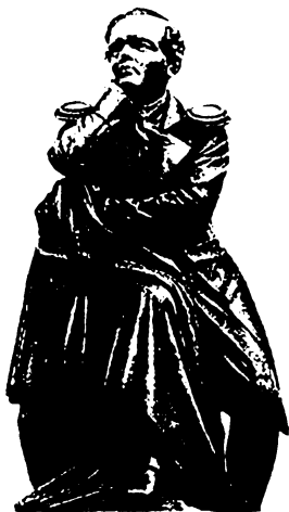
Памятник М. Ю. Лермонтову в Пятигорске. Скульптор А. М. Опекушин

дых офицеров. Здесь и произошла роковая ссора с Мартыновым, которая закончилась дуэлью с трагическим финалом.