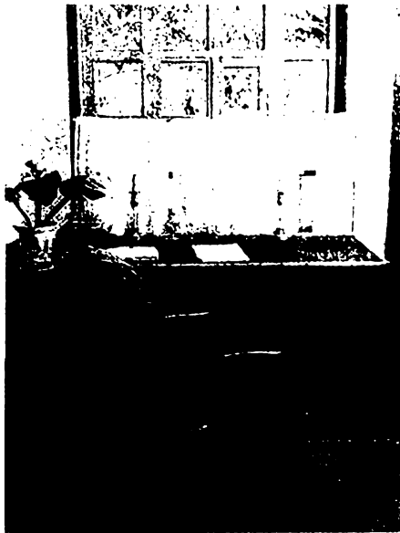
Кабинет М. Ю. Лермонтова в мемориальном музее в Пятигорске. Фотография

«водяное общество» Пятигорска. Попала на страницы повести и «эолова арфа», беседка, внутри которой в деревянном футляре были установлены две арфы, начинавшие звучать при порыве ветра. От беседки открывалась живописная панорама города и окрестностей, поэтому это место было избрано отдыхающими для прогулок между процедурами. По утрам отдыхающие собирались перед существующей до наших дней галереей пить лечебную воду. Лермонтов упоминает реально существовавший магазин Челахова и другие приметы хорошо знакомого ему города. Видимо, тогда же поэт начал работу над живописным полотном «Вид Пятигорска».