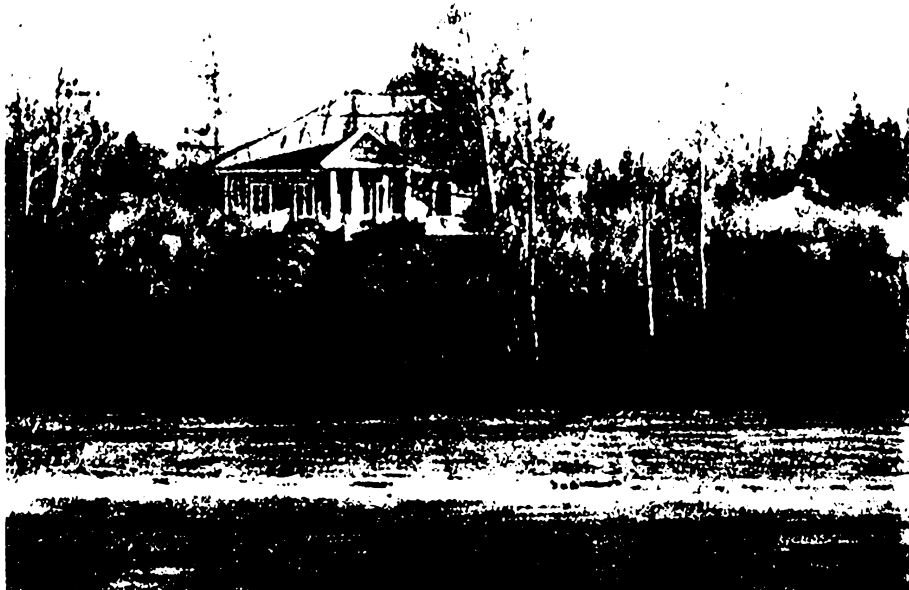
Михайловское. Дом-музей А. С. Пушкина. Фотография