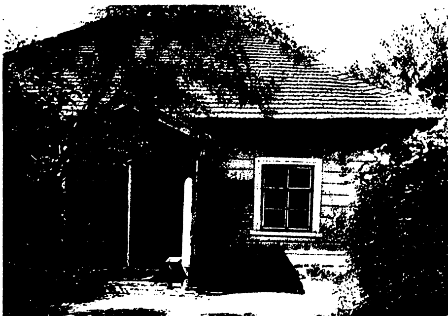
Михайловское. Домик няни. Фотография