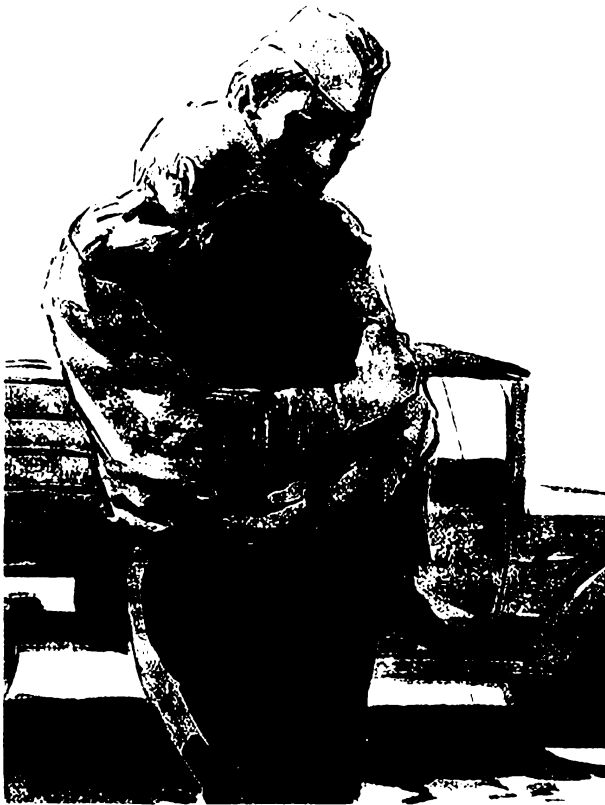
«Судьба человека». Художники Кукрыниксы

и спросил, как выдохнул: «Кто?» Я ему и говорю так же тихо: «Я — твой отец».