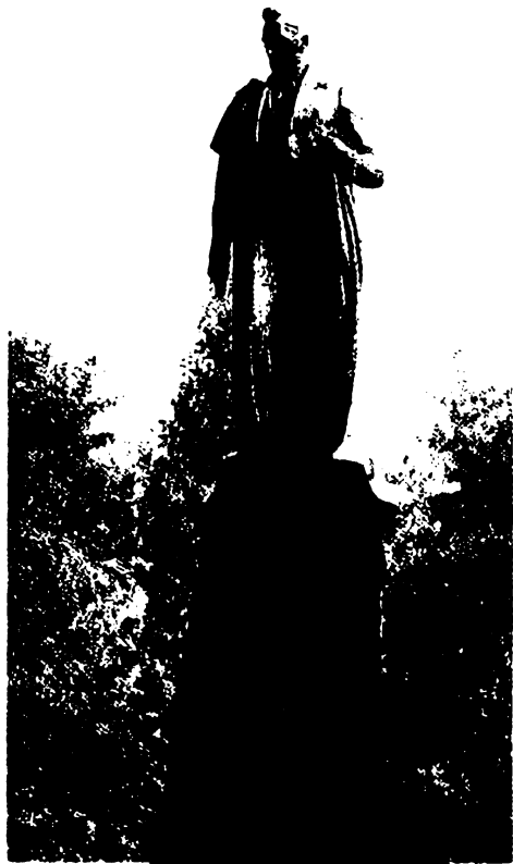
Памятник А. С. Грибоедову в Москве. Скульптор А. А. Мануйлов