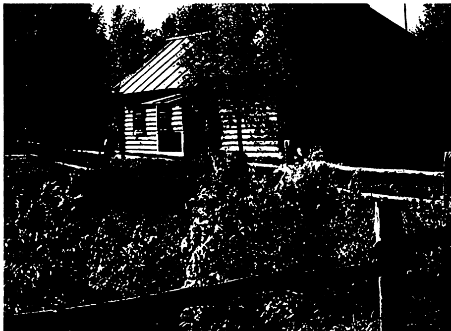
Дом Твардовских в Загорье. Фотография

торый был куплен отцом поэта Трифоном Гордеевичем через Земельный банк с выплатой в рассрочку. Этот клочок земли теперь известен как «поэтическое Загорье» — малая родина поэта, «начало всех начал».